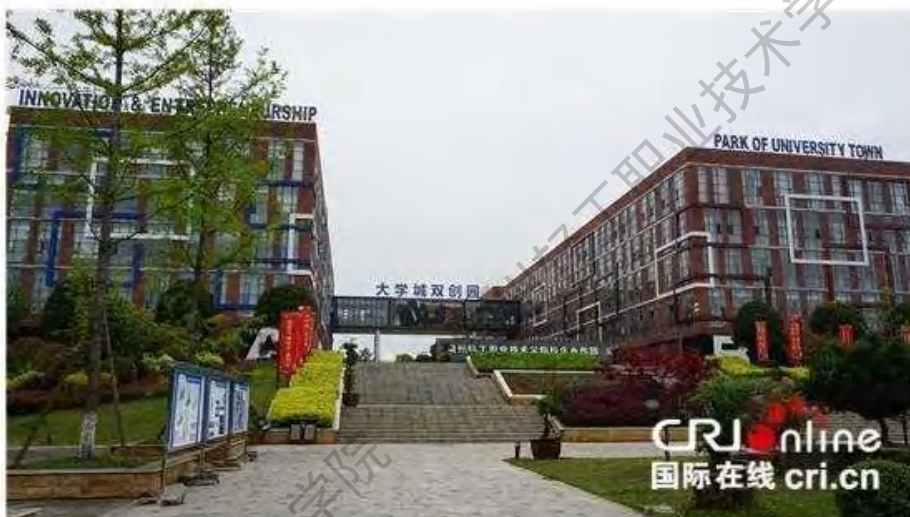
贵州省贵安新区大学城双创园